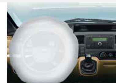
Túi khí cho người lái