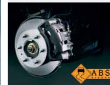
Hệ thống chống bó cứng phanh (ABS)