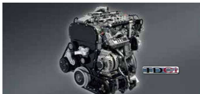
Động cơ Duratorq 2.4L TDCi Turbo Diesel