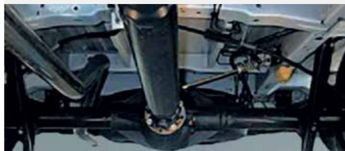
Mạnh mẽ hơn với hệ thống truyền động cầu sau