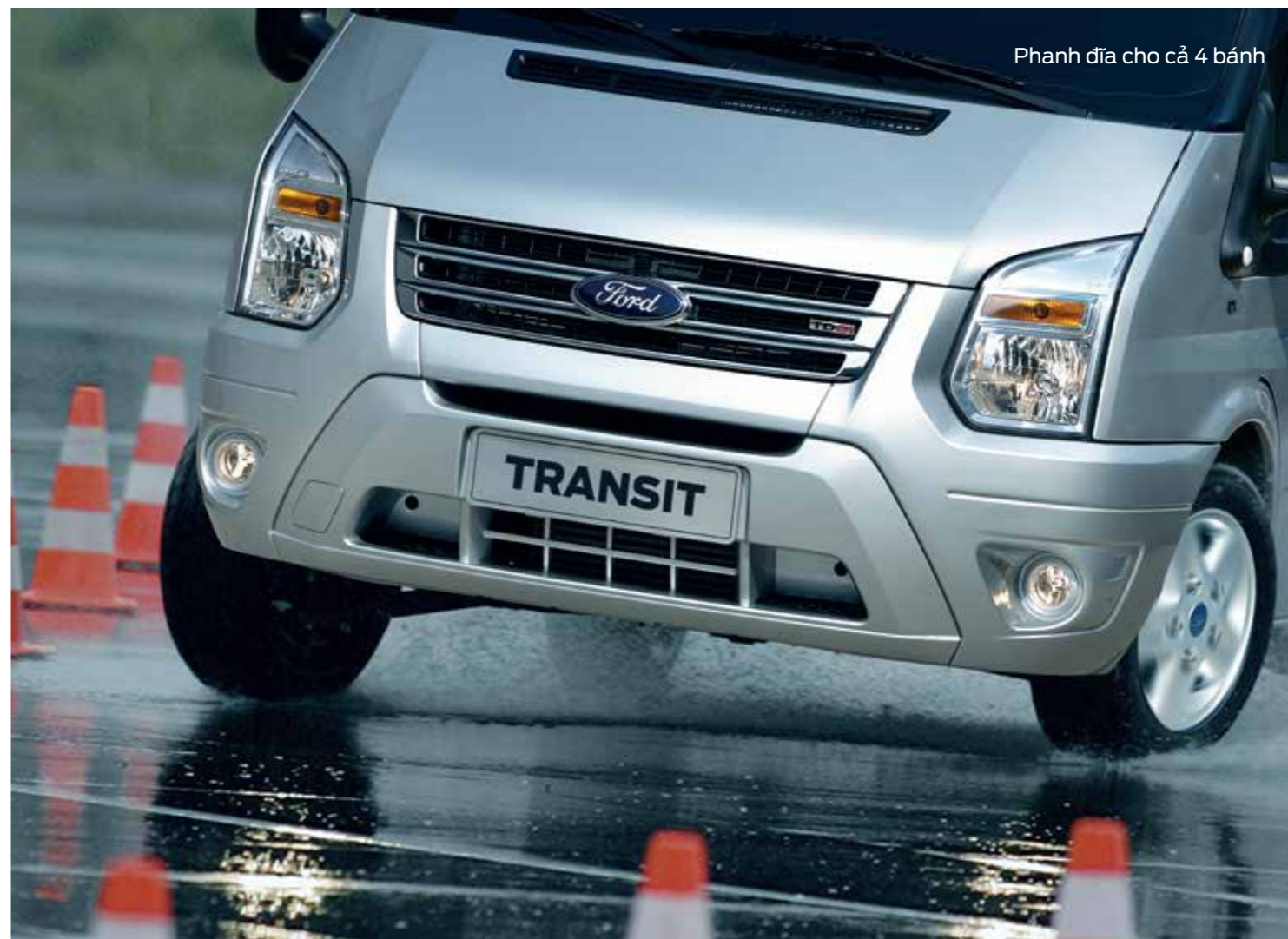
Phanh đĩa cho cả 4 bánh

Sự an toàn của bạn là điều chúng tôi quan tâm nhất. Ngoài cấu trúc khung vỏ được thiết kế theo tiêu chuẩn Châu Âu rất chắc chắn, Ford Transit còn được trang bị nhiều thiết bị an toàn chủ động giúp bảo vệ tối đa cho hành khách từ mọi hướng.