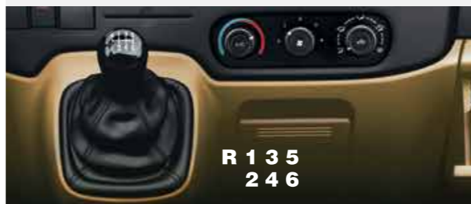
Hộp số sàn 6 cấp chuyển số êm ái