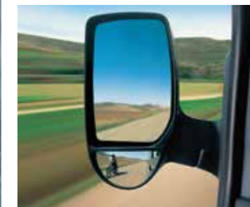
Gương chiếu hậu điều khiển điện