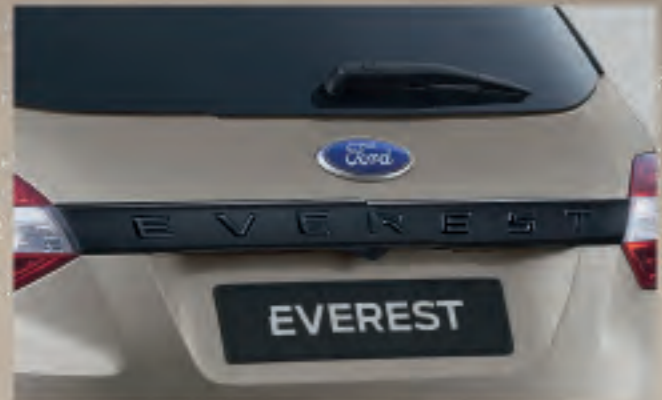
Ốp tay cốp sau chữ EVEREST