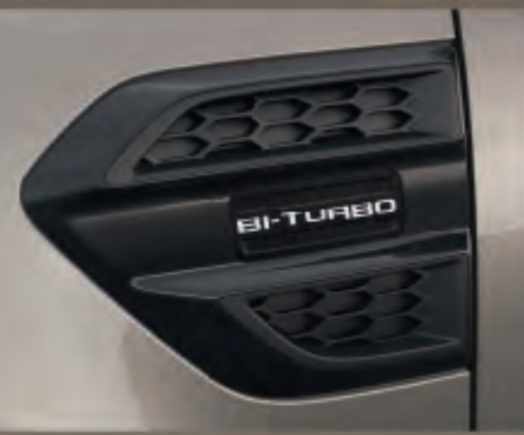
Ốp mang cá