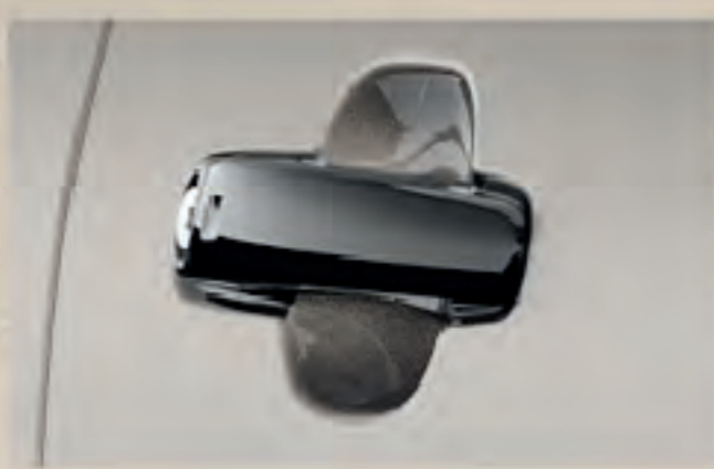
Ốp tay nắm cửa