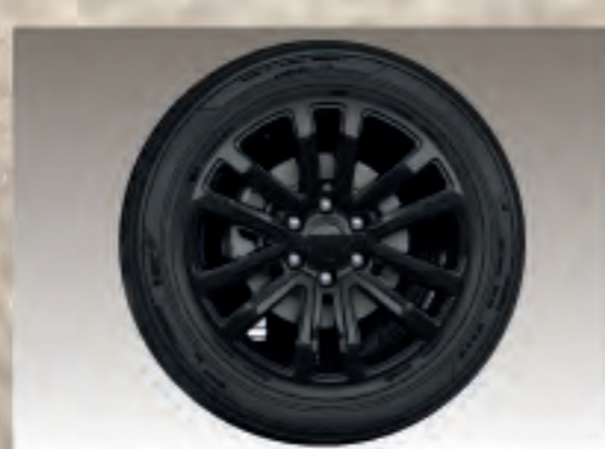
Vành hợp kim thể thao 20”