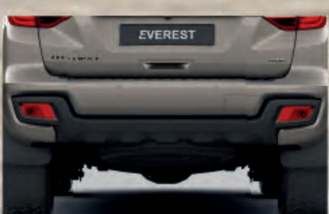
Ốp cản sau