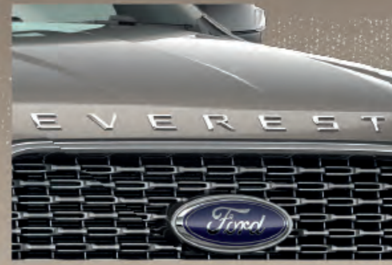
Decal chữ EVEREST mạ Chrome