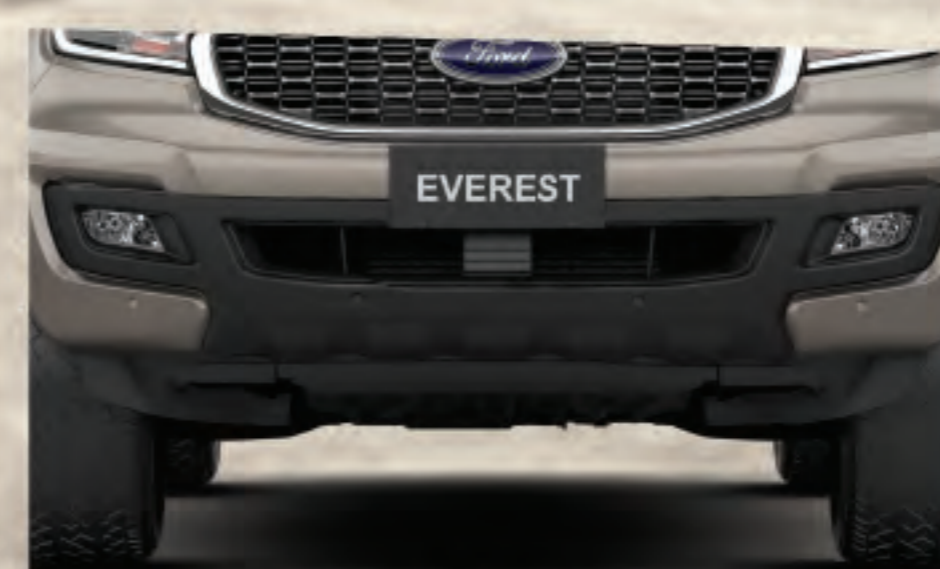
Ốp cản trước – không cảm biến