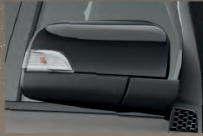
Ốp Gương chiếu hậu