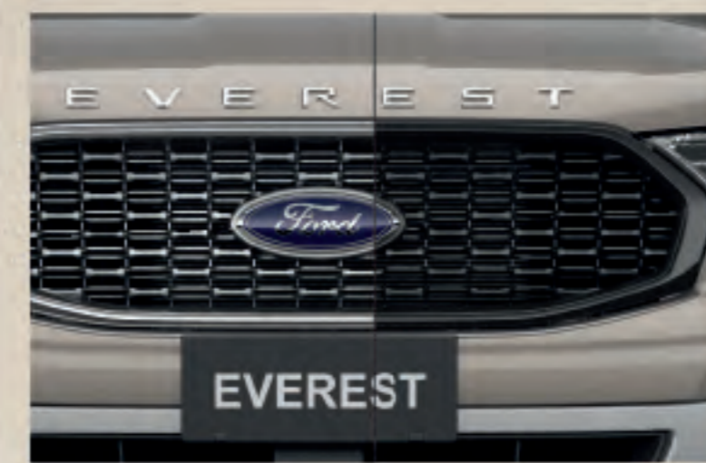
Lưới tản nhiệt mạ Chrome