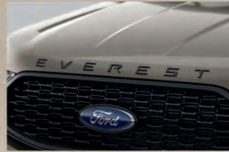
Decal chữ EVEREST phiên bản thể thao